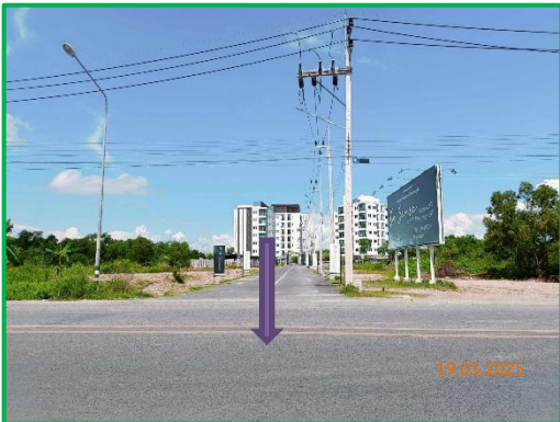
ภาพที่ 2-2 ถนนองค์การบริหารส่วนจังหวัดสงขลา 2051