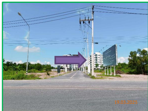
ภาพที่ 2-6 ป้ายชี้โครงการ