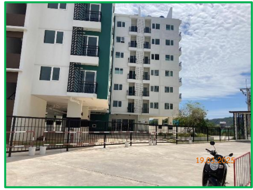
ภาพที่ 2-1 พื้นที่โครงการปัจจุบัน