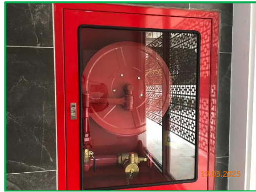
ภาพที่ 2-7 ตู้เก็บอุปกรณ์ดับเพลิง