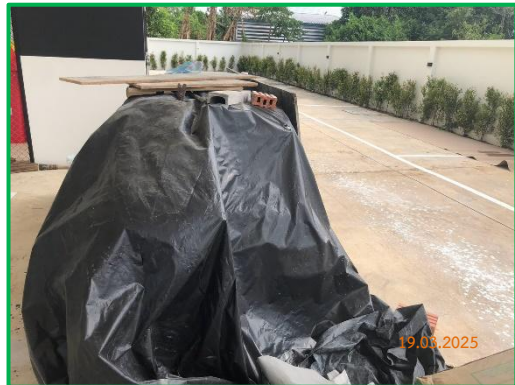
ภาพที่ 2-3 ผ้าใบคลุมวัสดุก่อสร้าง