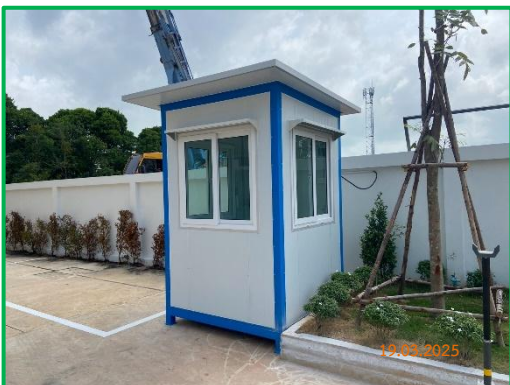
ภาพที่ 2-5 ป้อมยามบริเวณโครงการ